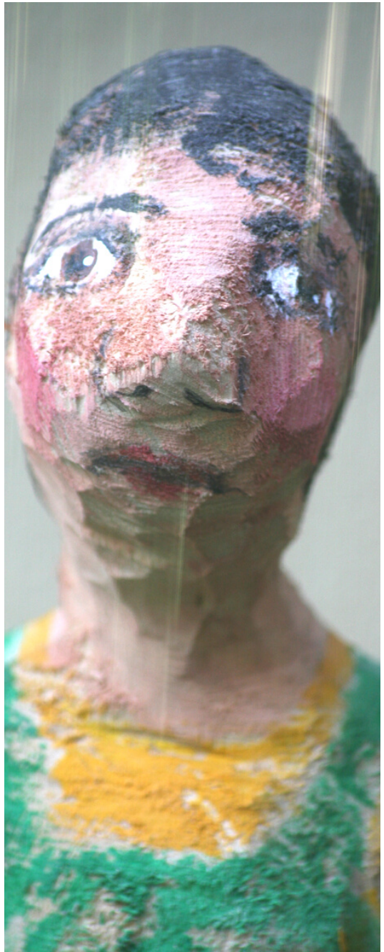
“Junge mit grüner Latzhose“ Lindenholz, Acryl 2022 ca. 11x8x35cm