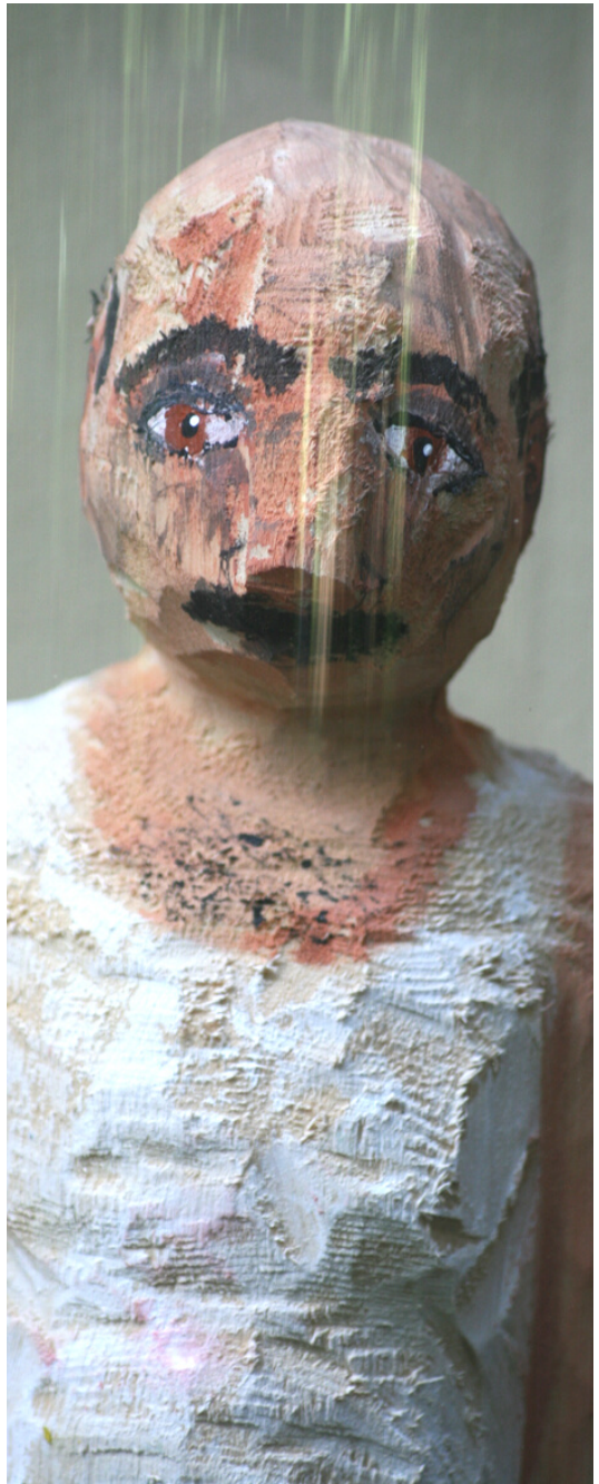
“Mann mit Tüten” Lindenholz, Acryl 2022 ca. 11x8x35 cm