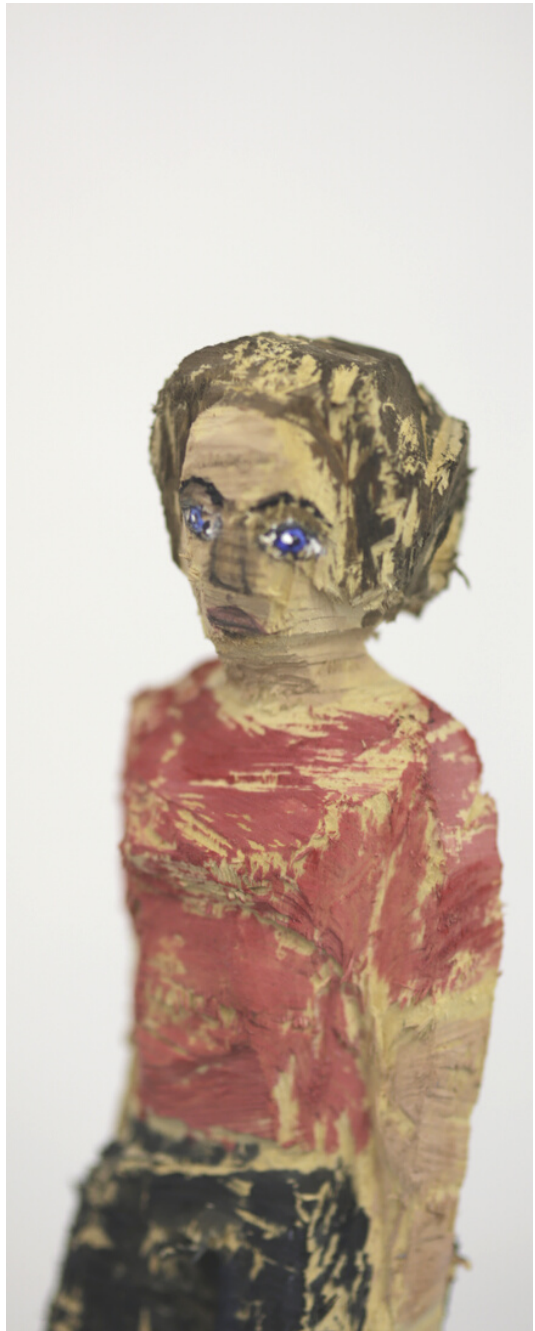
“Frau mit rotem T-Shirt” Lindenholz, Acryl 2022 ca. 7x9x25 cm