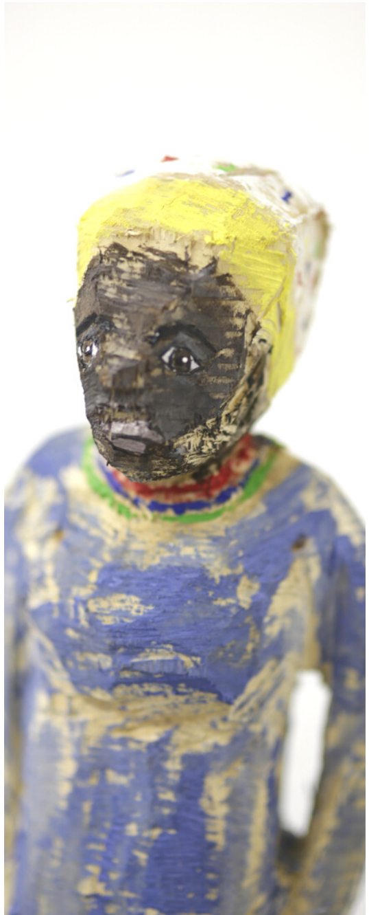
“Frau mit blauem Kleid” Lindenholz, Acryl 2022 ca.10x15x40 cm