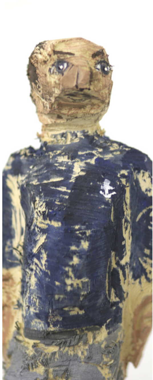
“Mann mit Anker” Lindenholz, Acryl 2022 ca.7x9x25 cm