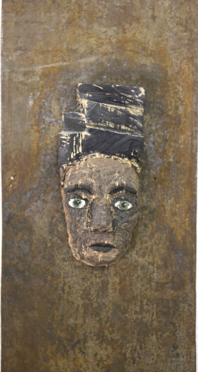
“Person” Lindenholz, Acryl, Stahl 2021 ca.25.x10x80 cm