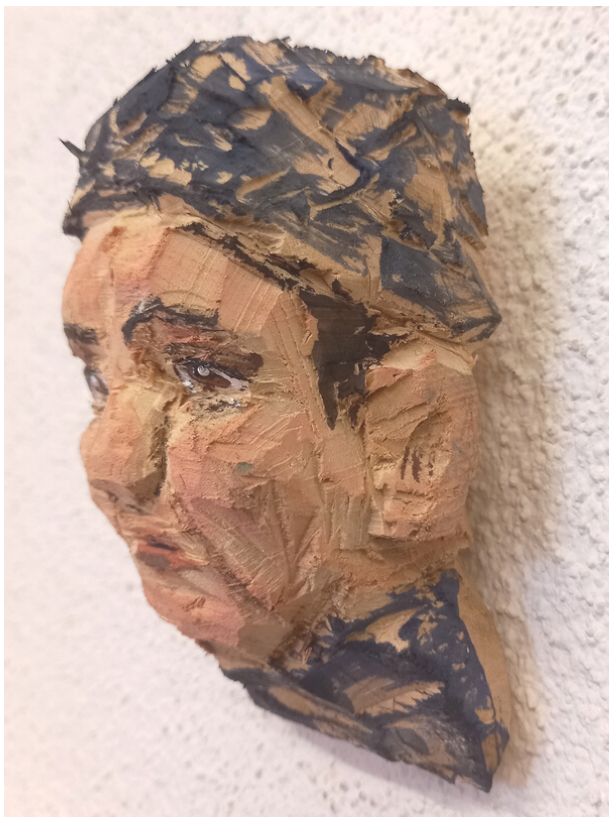
"Mensch mit blauer Kappe" Lindenholz, Acryl 2023 ca. 8x5x14cm