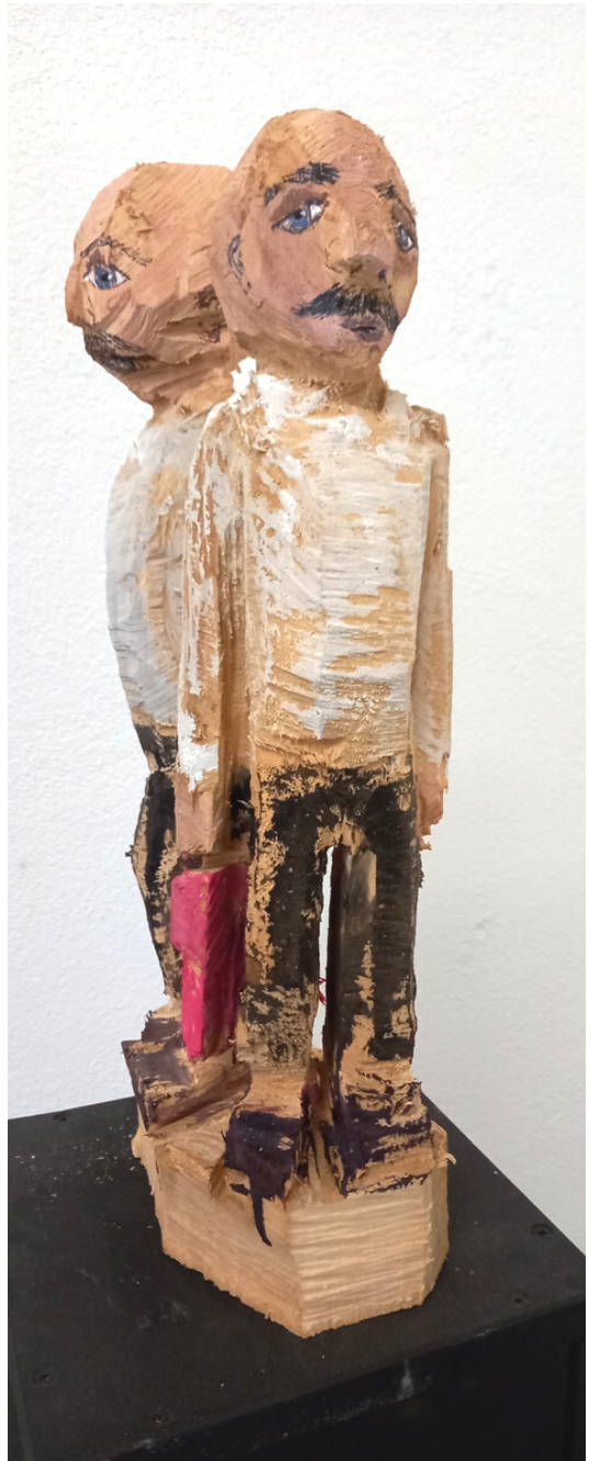
“Männer mit Tüten” Lindenholz, Acryl 2023 ca. 20x15x35cm