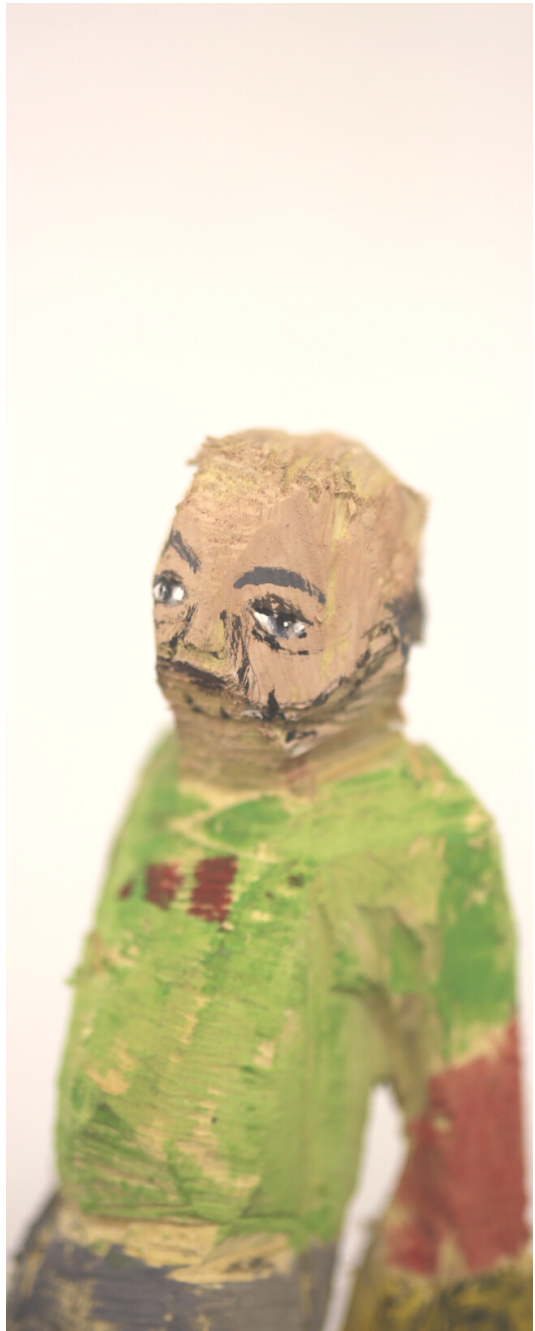
“Mann mit Horn” Lindenholz, Acryl 2022 ca. 10x12x25 cm