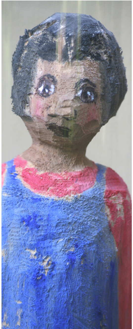
“Mädchen mit blauem Kleid” Lindenholz, Acryl 2022 ca. 11x8x35 cm